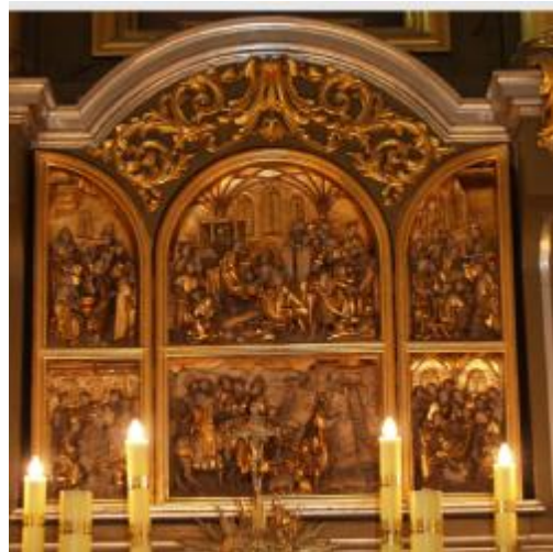
Kopia Tryptyku umieszczona w kościele parafialnym w Pławnie