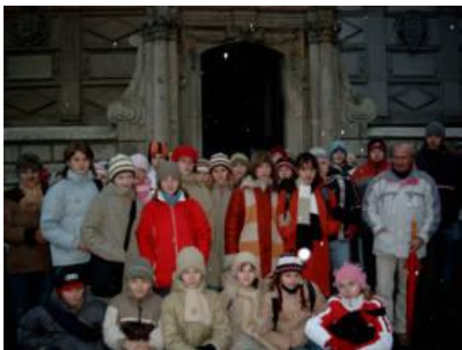
Uczestnicy wycieczki do Krakowa pod Wawelem

Elementem kończącym całość zmagania związanych z realizacją projektu jest opracowanie i wydanie w większym nakładzie, folderu informacyjno-turystycznego promującego Gminę Gidle.