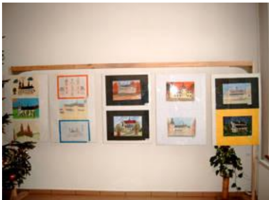
Wystawa prac plastycznych wykonanych w ramach konkursu Gotyckie i barokowe zabytki Ziemi Gidelskiej i Pławińskiej

- warsztaty plastyczne pod nazwą „Gotyckie i barokowe zabytki Ziemi Gidelskiej i Pławińskiej” prowadzone przez nauczycieli plastyki we wszystkich szkołach Gminy. Głównym celem tych warsztatów było zapoznanie młodzieży z różnymi technikami wykonywania prac plastycznych. Natomiast podsumowaniem był ogłoszony przez Gminną Bibliotekę Publiczną konkurs na wykonanie prac przedstawiających gotyckie i barokowe zabytki znajdujące się na terenie naszej Gminy.