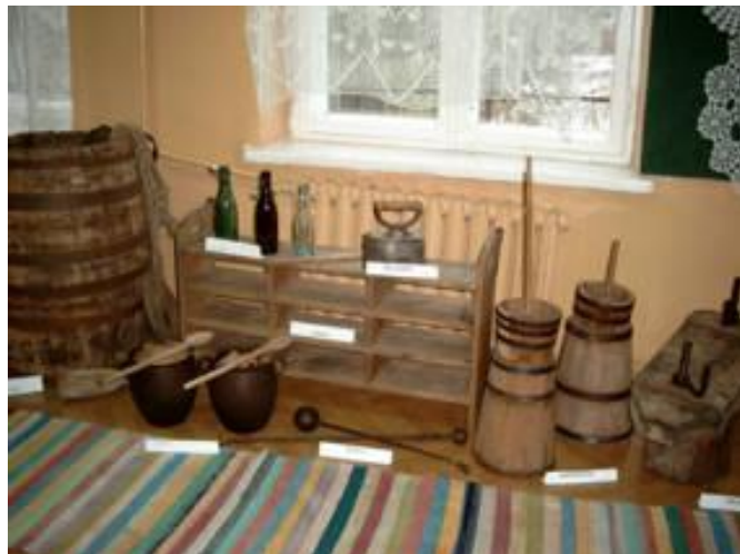
Ekspozycje zebrane przez młodzież ze szkoły w Wojnowicach

Kolejna część projektu przewidywała rozwój nowej funkcji kulturalno-edukacyjnej Biblioteki, którą zrealizowano poprzez zakup oprogramowania do zautomatyzowania wielu procesów bibliotecznych takich jak: gromadzenie zbiorów, katalogowanie różnorodnych materiałów bibliotecznych, wyszukiwanie i zestawianie informacji o posiadanych zbiorach ich ewidencja i udostępnianie. Będzie to jedna z nielicznych placówek, w powiecie radomszczańskim, wyposażona w tak innowacyjne rozwiązanie. Wprowadzenie nowej formy udostępniania zbiorów przyczyni się do sprawnej obsługi czytelników, a w przyszłości pozwoli na współpracę on-line z bibliotekami pracującymi w takich systemach.