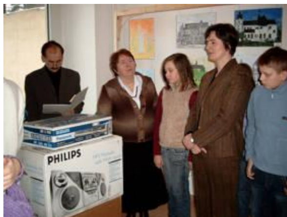
Wręczenie nagród dla zwycięzców w konkursach organizowanych w ramach projektu